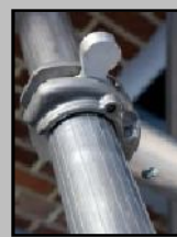
Anclajes automáticos de máxima seguridad