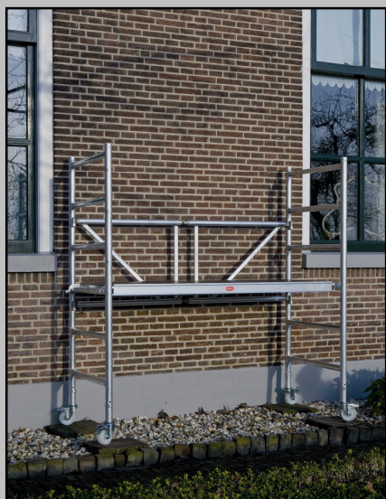
Pack Base 1m altura de plataforma PRECIO A: 424€

Andamio de aluminio de base plegable fabricado con tubo de 40mm. de diámetro y con un espesor de 1,6mm. Es un producto ideal para cualquier tipo de trabajo, ya sea en interiores o en exteriores.