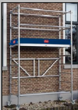
Composición A + B. Pack base + 1 extensión Altura plataforma: 1,80m PRECIO A+B: 723€

Modelo ampliable a dos alturas más. Comprando los paquetes de extensión necesarios, podemos ampliar nuestro pack base hasta una altura de plataforma de 1,80m o bien hasta 3,80m, en función de nuestras necesidades.