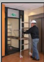
Ideal para interiores

Andamio de aluminio de base plegable fabricado con tubo de 40mm. de diámetro y con un espesor de 1,6mm. Es un producto ideal para cualquier tipo de trabajo, ya sea en interiores o en exteriores.