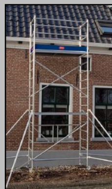
Composición A + B + C. Pack Base + 2 extensiones Altura plataforma: 3,80m PRECIO A+B+C:1278€

Todas sus extensiones están debidamente certificadas y tienen un precio inmejorable.