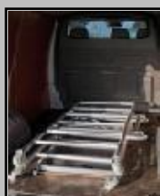
Facil de almacenar y de transportar